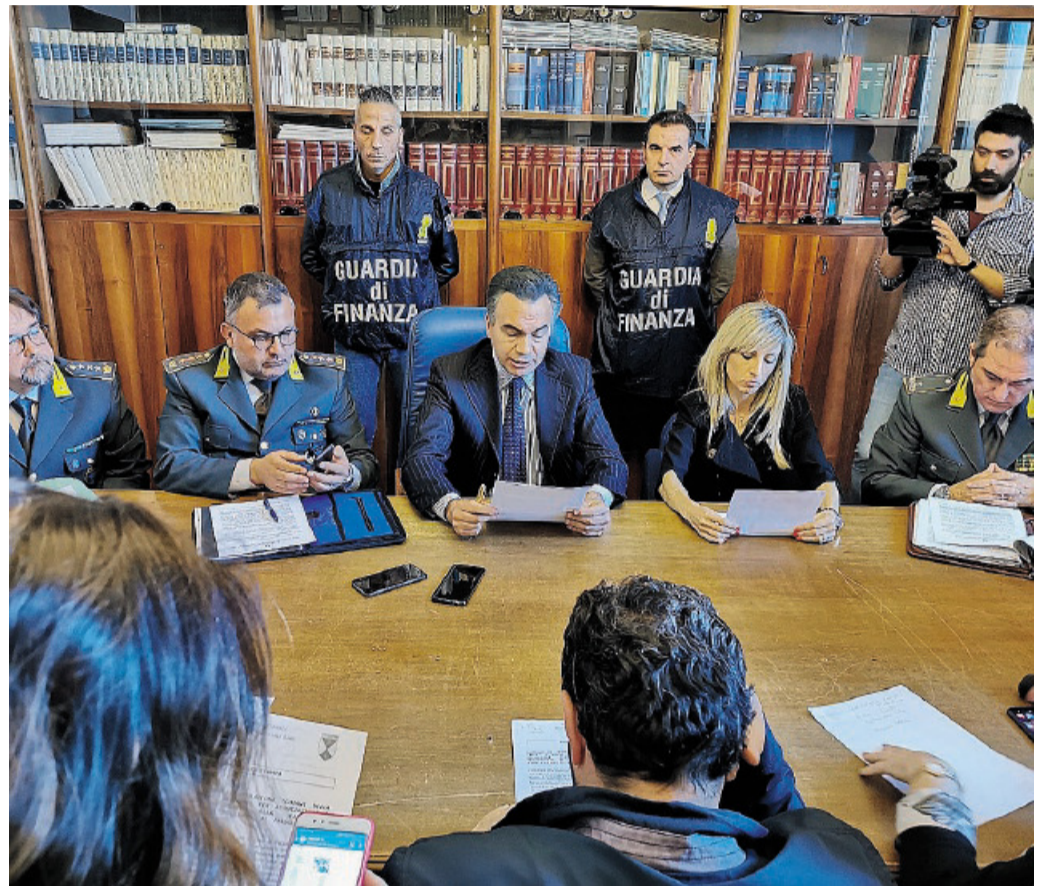
TRANI La conferenza stampa tenuta venerdì in Procura

IL CASO IL SITO È TUTTORA FRUIBILE A SINGHIOZZO. LE MILLE OCCASIONI PERDUTE E LE PROSPETTIVE PER IL FUTURO