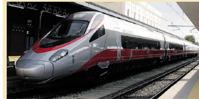
TRASPORTI Un treno veloce Frecciargento

Le corse da e per Roma operative dal 9 giugno con il nuovo orario